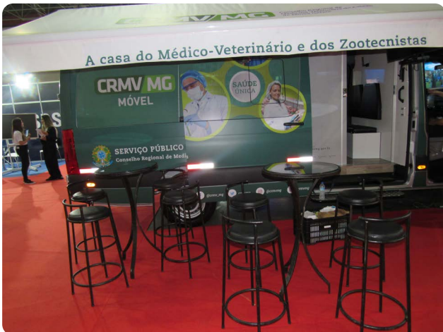
Congresso Mineiro de Municípios