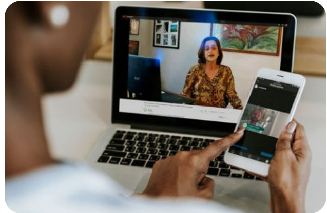
CRMV-MG também destacou importância dos profissionais na saúde pública

"A Medicina Veterinária vai muito além de cuidar dos animais. Médicos e médicas veterinárias garantem a nossa segurança alimentar, na inspeção de alimentos de origem animal, como carne, leite, ovos e mel. Também atuam no combate as zoonoses, prevenindo as doenças transmitidas dos animais para os homens, contribuindo ainda no desenvolvimento de medicamentos e vacinas