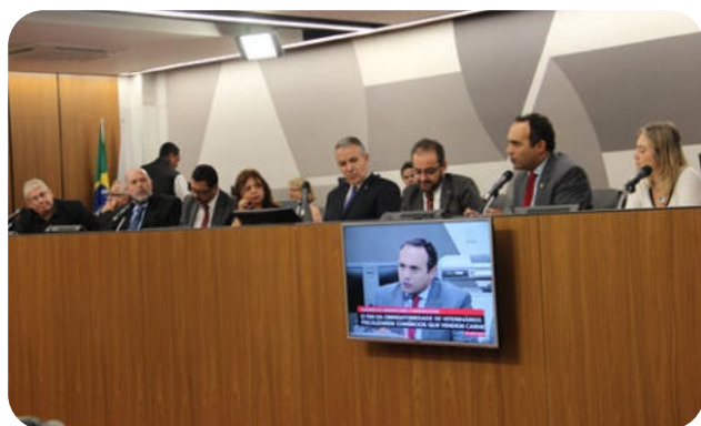
Audiência pública na Assembleia Legislativa debateu o tema em agosto de 2019